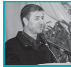
دکتر حدادی اصل: نقش پیشکسوتان در جایگاه کنونی پژوهشگاه انکار ناپذیر است ۳