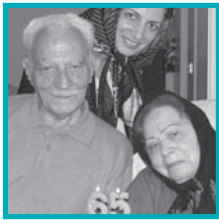
عشق ضربدر ۶۵ ۱۴