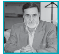
پیام رییس صندوق بازنشستگی به مناسبت روز خانواده و تکریم بازنشستگان ۴

در نخستین جشن تجلیل از بازنشستگان پژوهشگاه صنعت نفت دیدارها تازه و برگزارکنندگان غافلگیر شدند