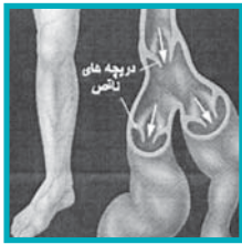
واریس وقتی رگ و ریشه پاها طغیان می کنند ۱۲