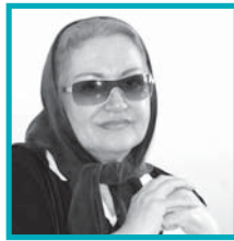
هفت سال بی «امان» ۱۱