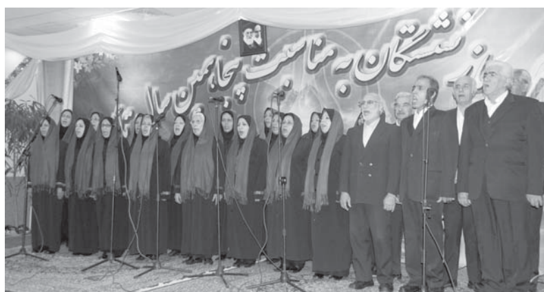
سرود جمهوری اسلامی ایران و ترانه‌های خاطره انگیز توسط گروه پیشکسوتان موسیقی فرهنگسرای سالمند اجرا شد

گفتنی است که در پایان این مراسم خاطره انگیز به کلیه بازنشستگان سال‌های دور و نزدیک این مرکز بزرگ علمی لوح تقدیر و هدیه ویژه اهدا شد.